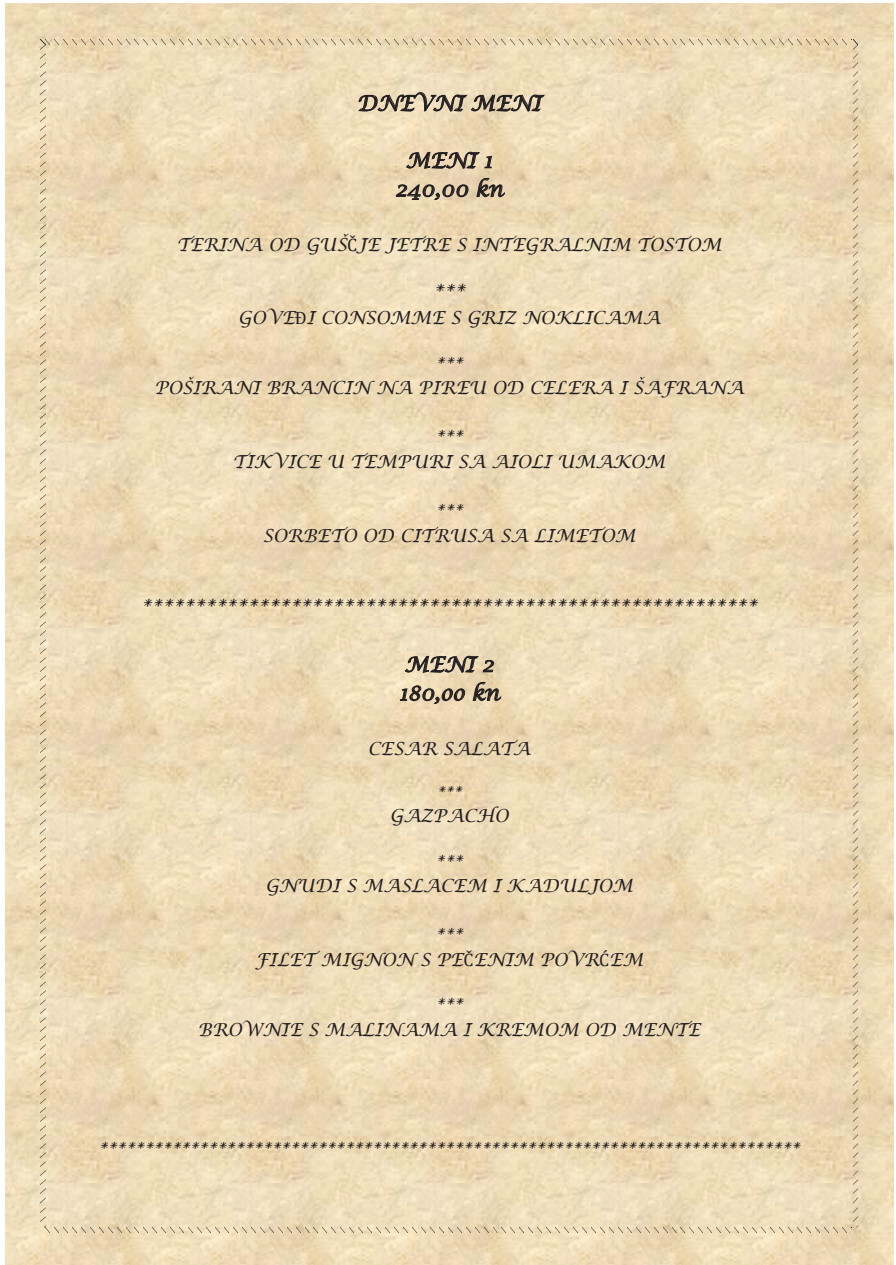
Slika 1. Prikaz menija koji nije prilagođen osobama s invaliditetom