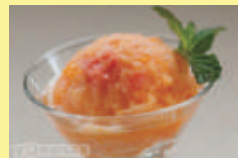
Slika 2. Prikaz menija koji je prilagođen osobama s invaliditetom